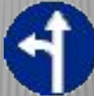
Движение прямо или налево