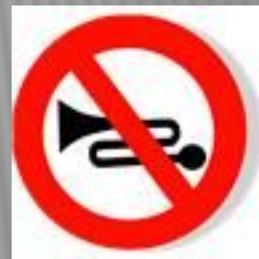
Подача звукового сигнала запрещена