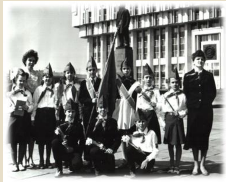
Приём в пионеры 1990г.