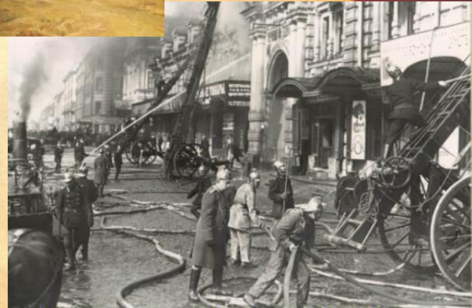
Июль 1941г. Ш. Л. П. С. - на Л. П. С. 25