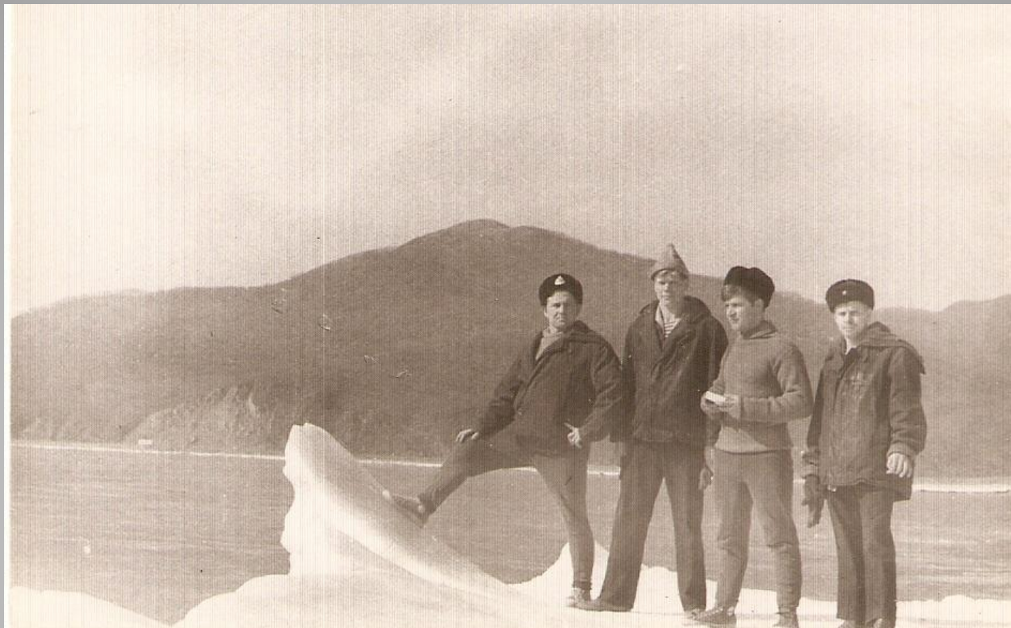
С сослуживцами на берегу моря в бухте Стрелок. Вдали видна гора Большой Иосиф.