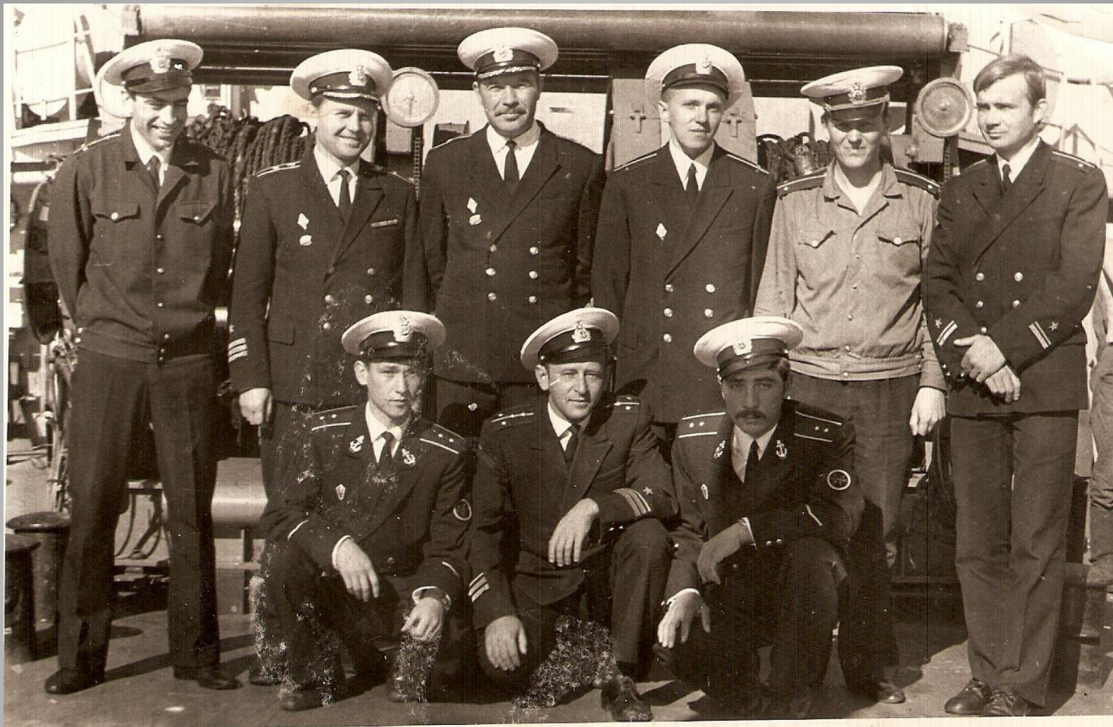
На палубе морского тральщика «Аквамарин»