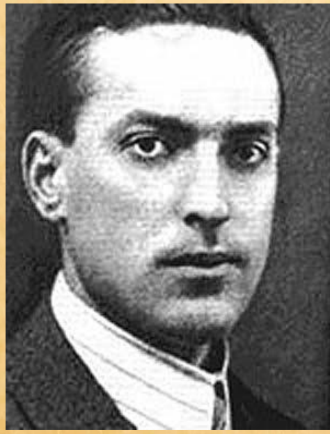
Л. С. Выготский