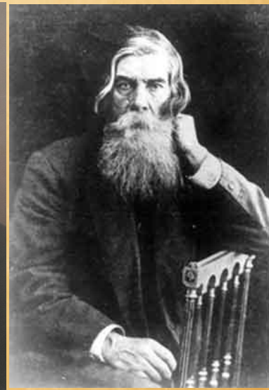
В. М. Бехтеров