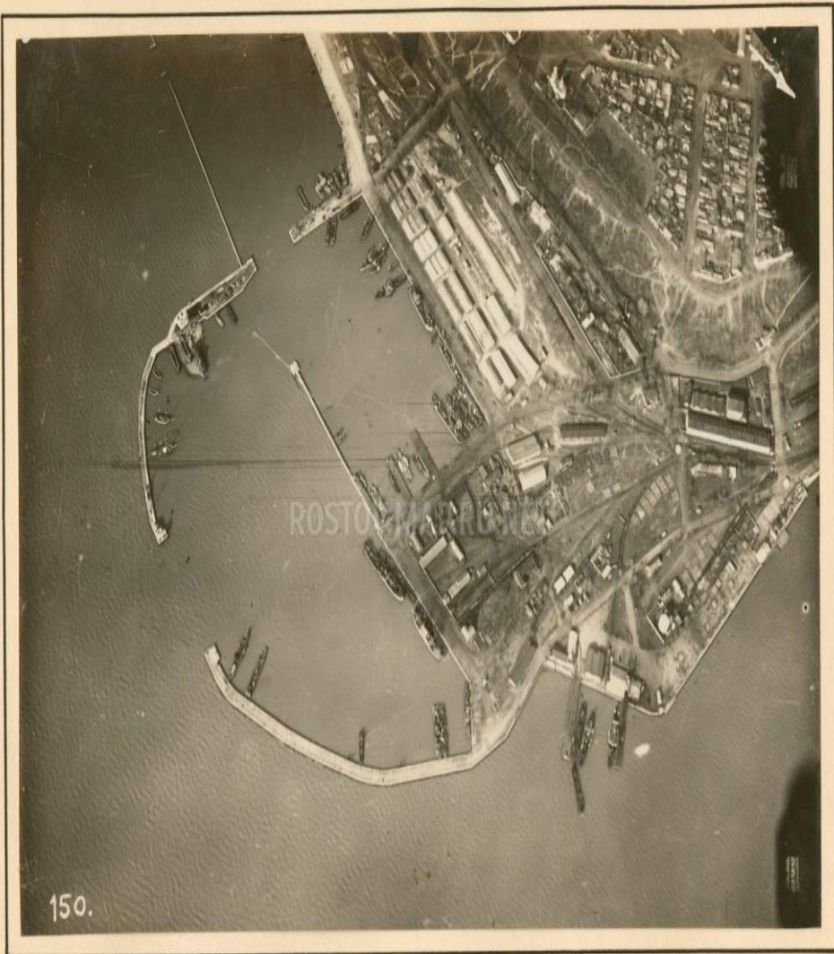
Гафен von Таганрог.