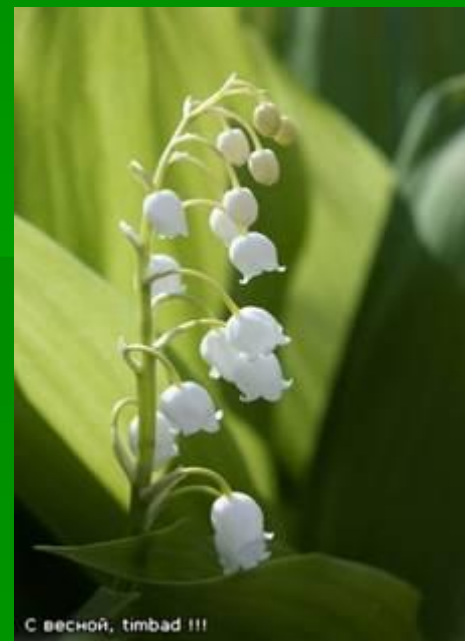
С весной, timbad !!!