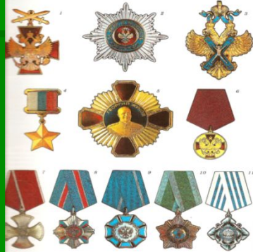
1. Орден Отечественной войны I степени. 2. Орден Отечественной войны II степени. 3. Орден «Матери-героини». 4. Орден Отечественной войны I степени. 5. Орден Отечественной войны II степени. 6. Орден Отечественной войны I степени. 7. Орден Отечественной войны II степени. 8. Орден Отечественной войны I степени. 9. Орден Отечественной войны II степени. 10. Орден Отечественной войны I степени. 11. Орден Отечественной войны II степени.