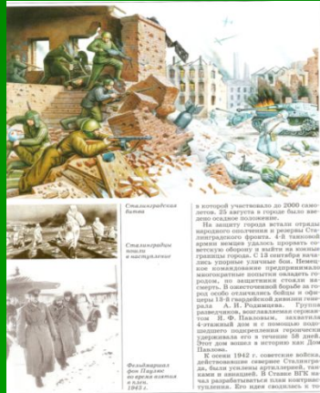
Силы вермахта в Баку