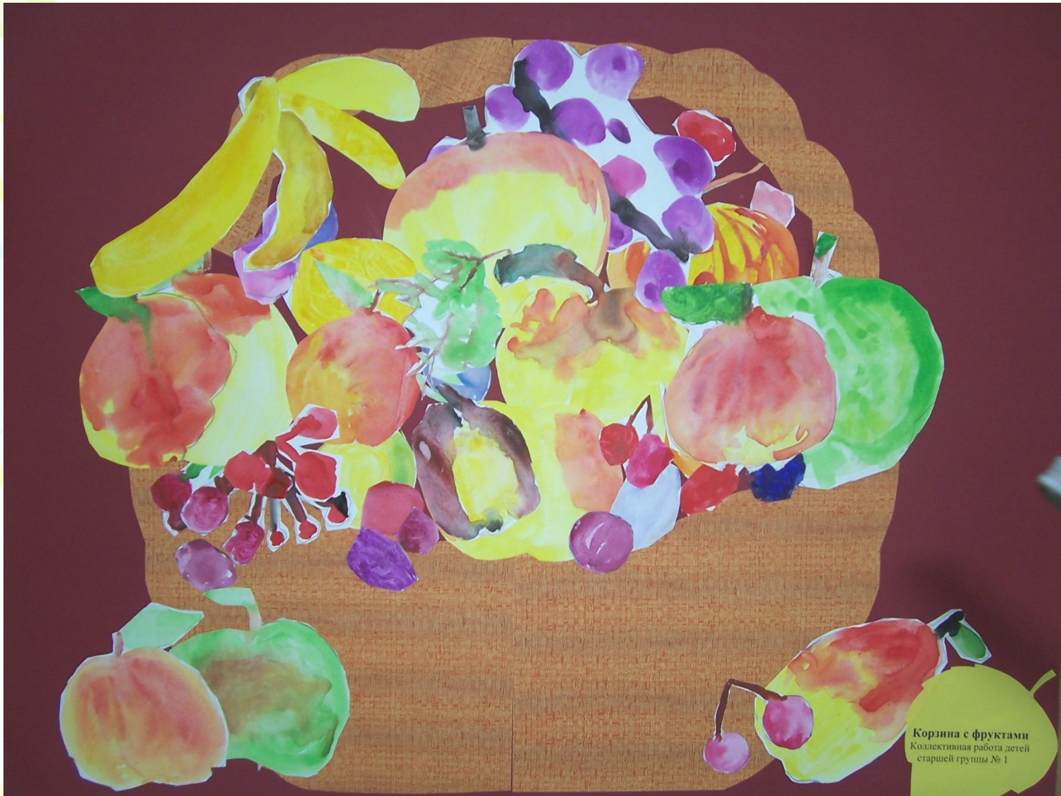
Корзина с фруктами Коллективная работа детей старшей группы № 1