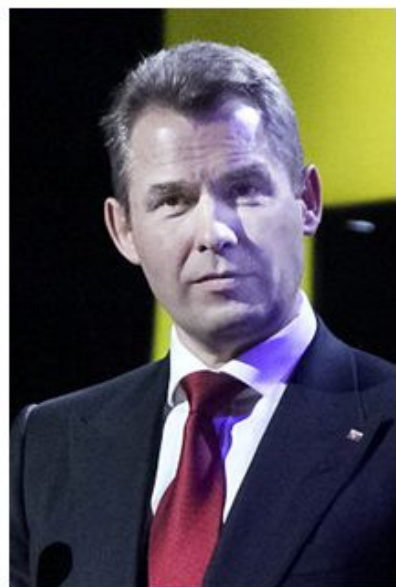
Павел Алексеевич Астахов

Уполномоченный при президенте Российской Федерации по правам ребёнка