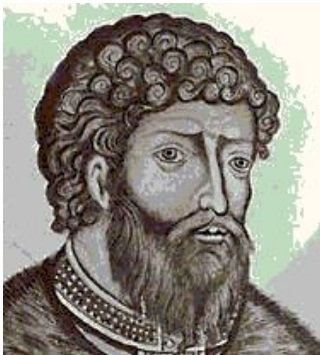
Великий князь Ярослав Владимирович