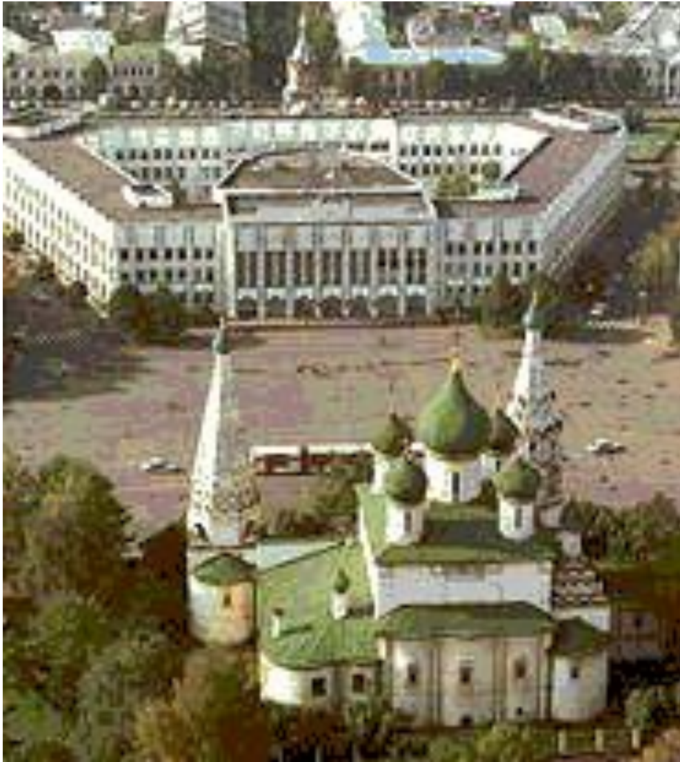
Ярославль. Панорама города с видом церкви Ильи Пророка.