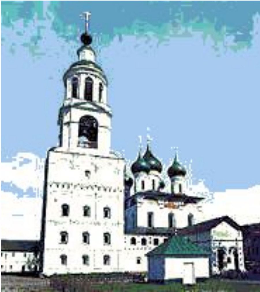
Введенский собор (1681 – 1688) с колокольней Толгского монастыря. Вид с юго – запада.