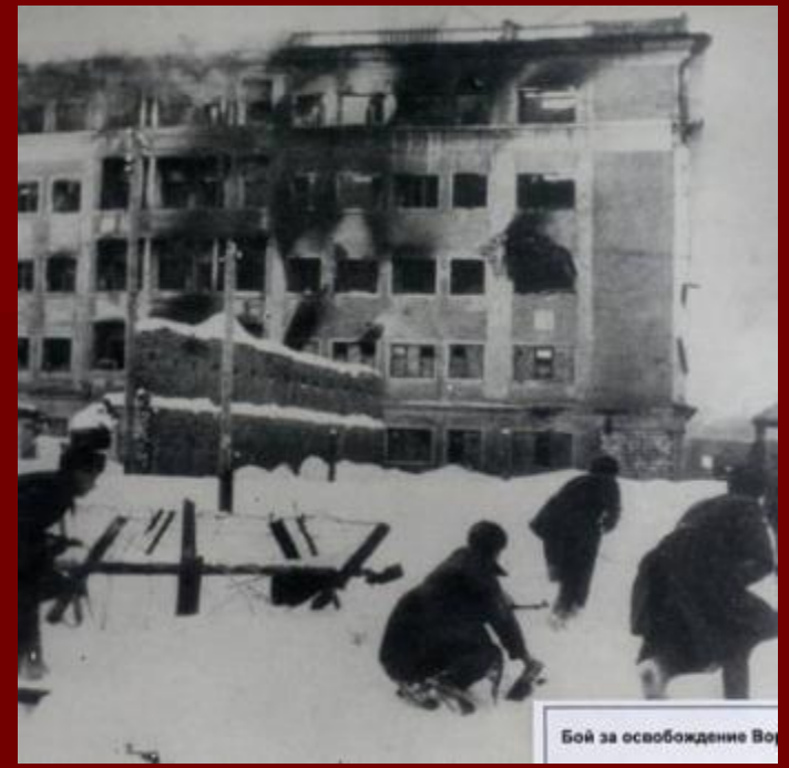
Бой за освобождение Во