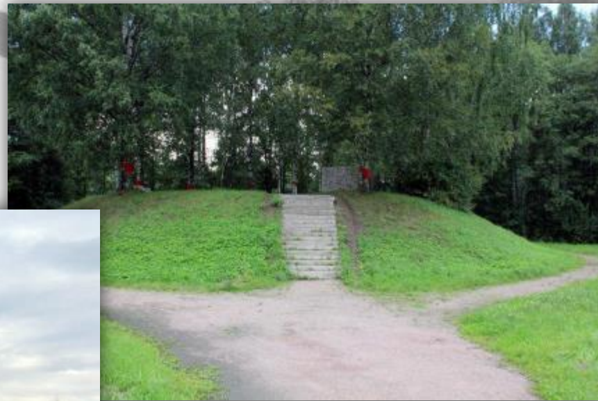
Зеленый пояс Славы