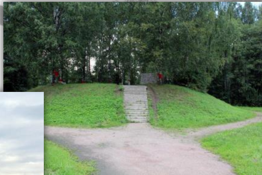
Зеленый пояс Славы