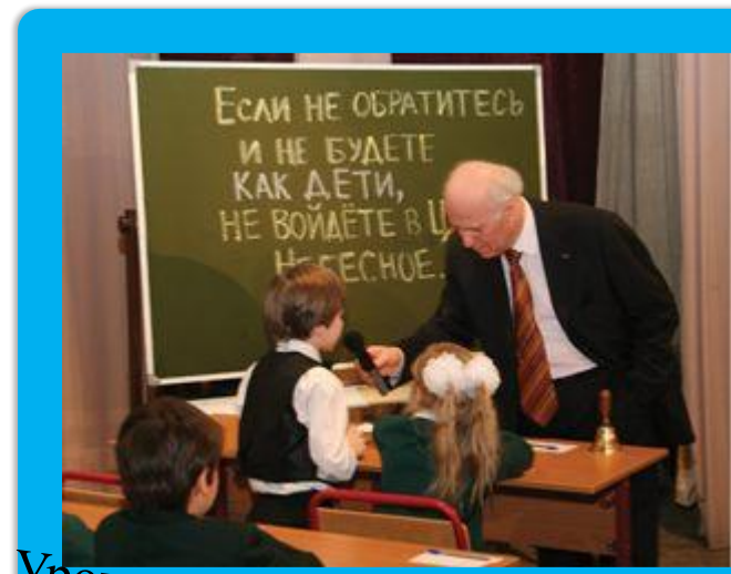
Урок ведет Ш.А. Амонашвили