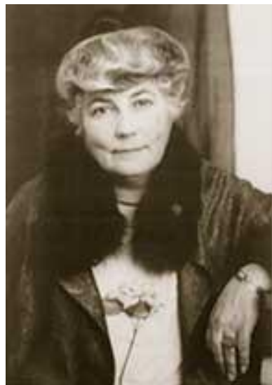
Елена Ивановна Рерих

Благодаря непосредственному участию семьи Рерихов была создана философия космической реальности – Живая Этика.