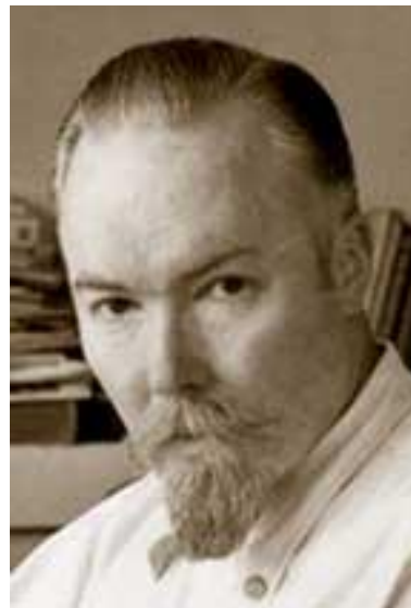
Святослав Николаевич Рерих