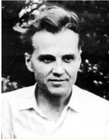
В. А. Сухомлинский