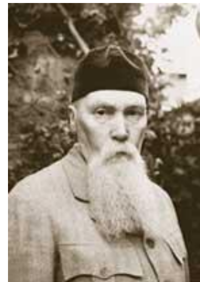
Николай Константинович Рерих

Живая Этика составляет основу теории гуманно-личностной педагогики – педагогики третьего тысячелетия.