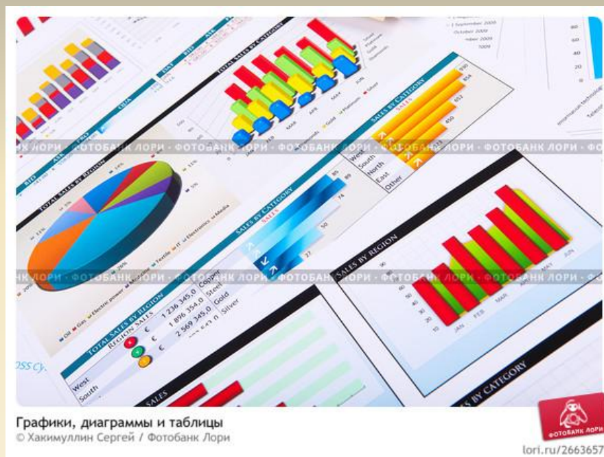
Графики, диаграммы и таблицы