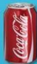
БАНКА ИЗ-ПОД НАПИТКА