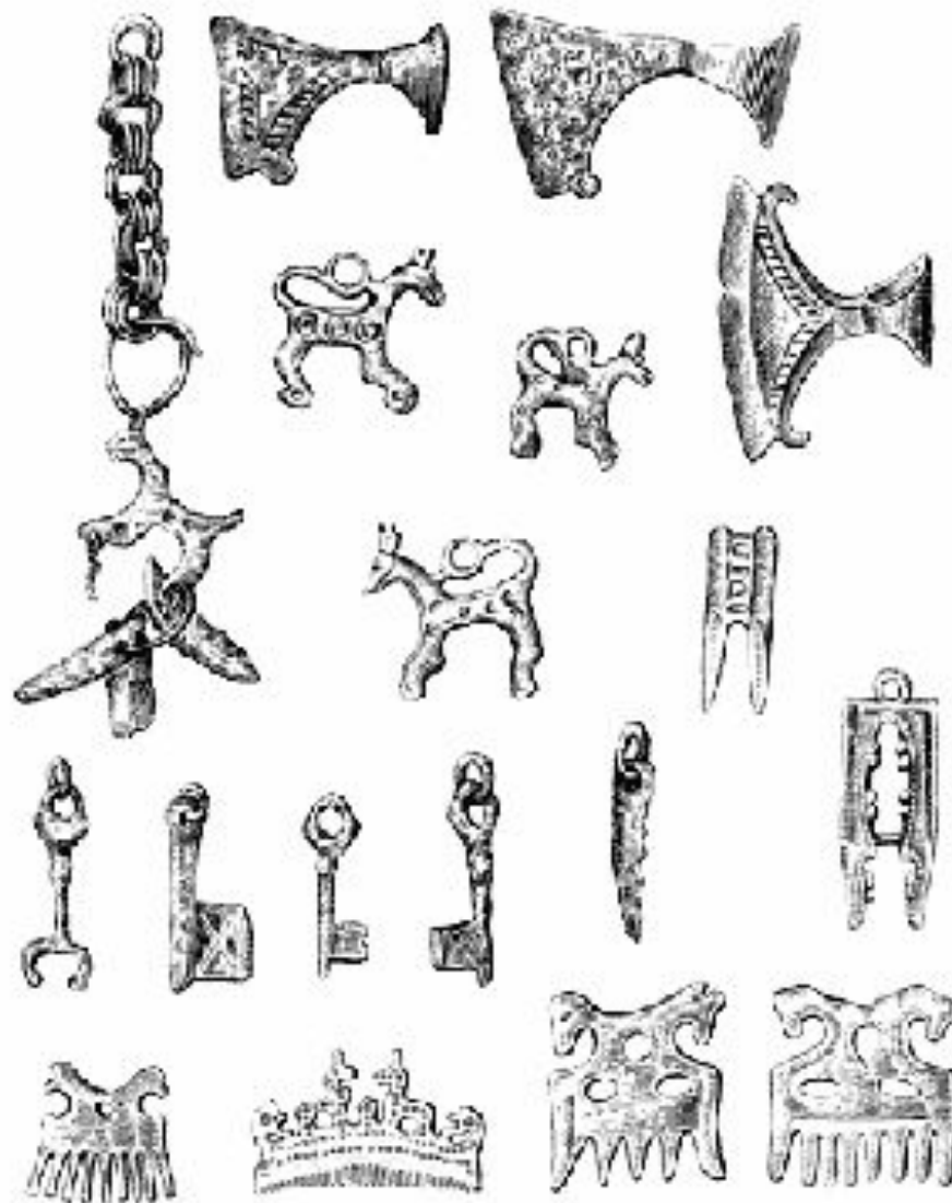
Рис. 92. ОБЕРЕГИ.

Наверху многократные тисорки, далее — рисунки в стилистически изображенные чешотки хитриков. Внизу — модели ключей и тисорки