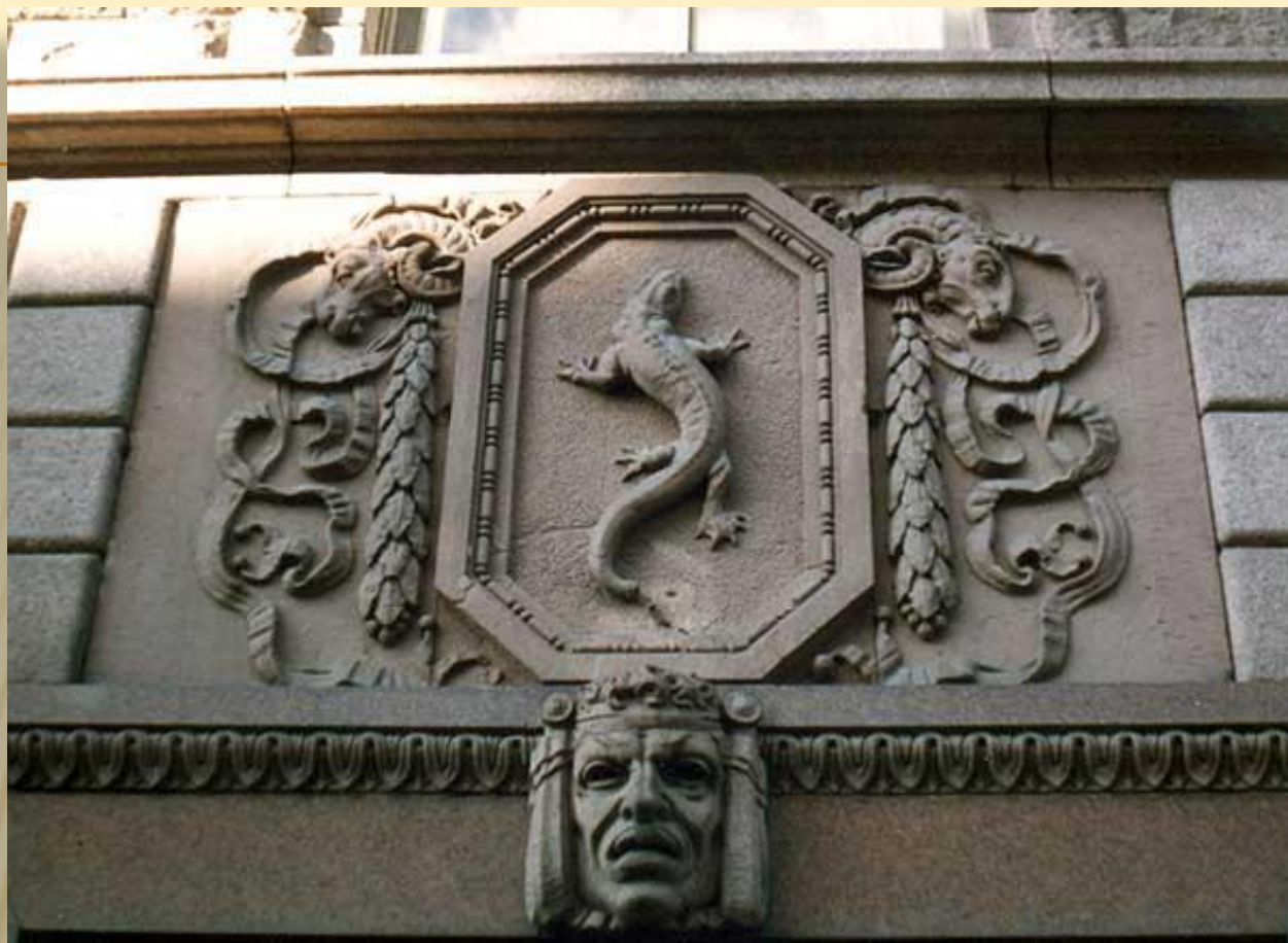
Доходный дом страхового общества "Саламандра"