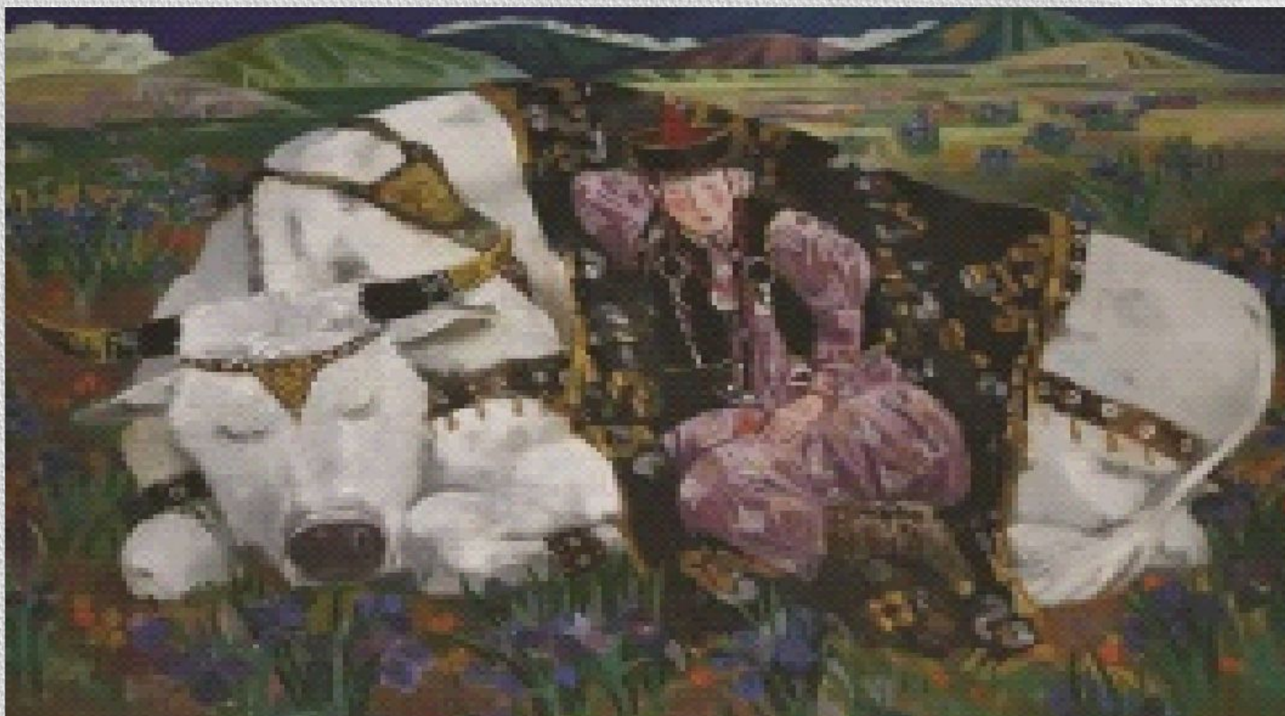
• Долина ирисов Живопись