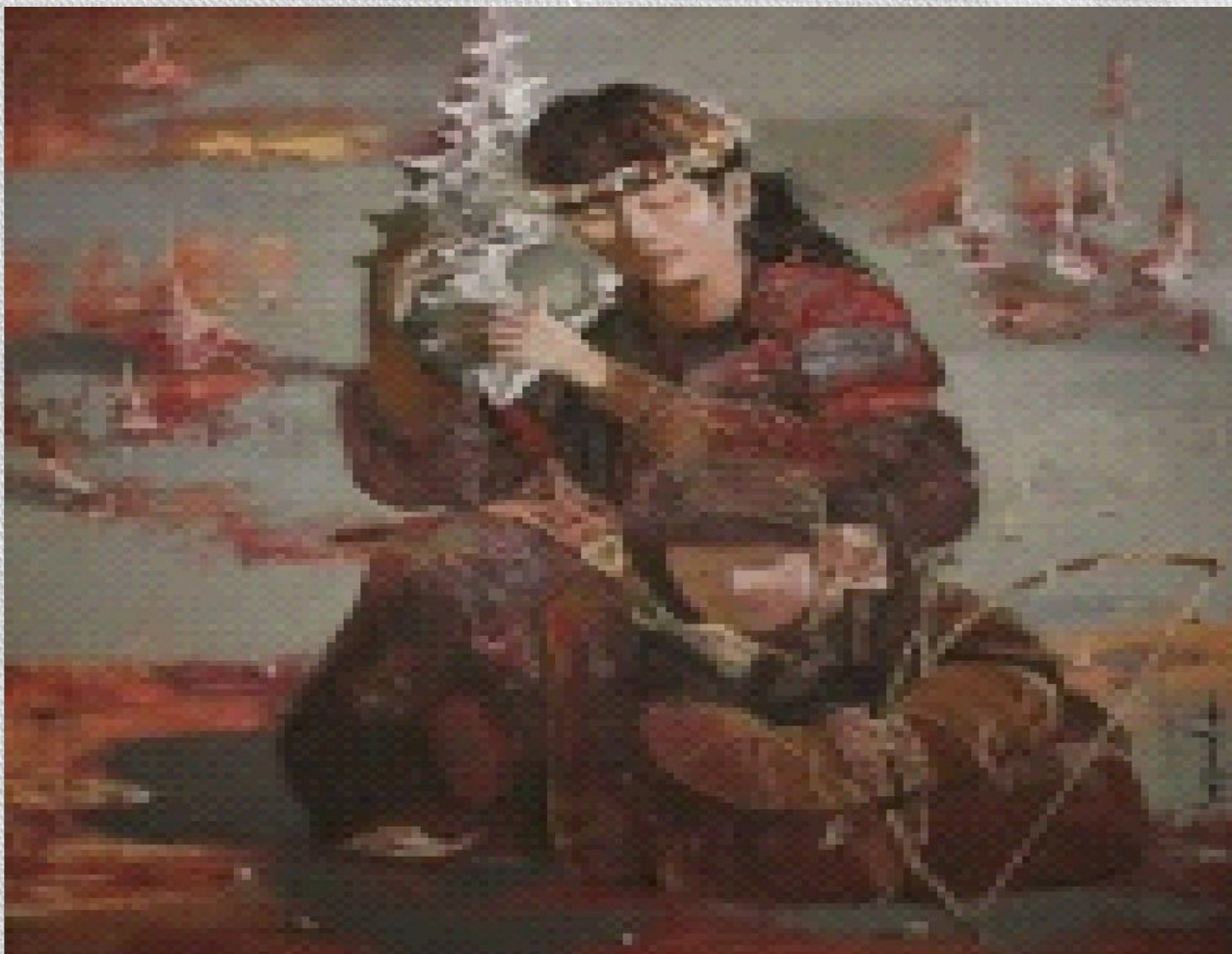
• Слушают море Живопись