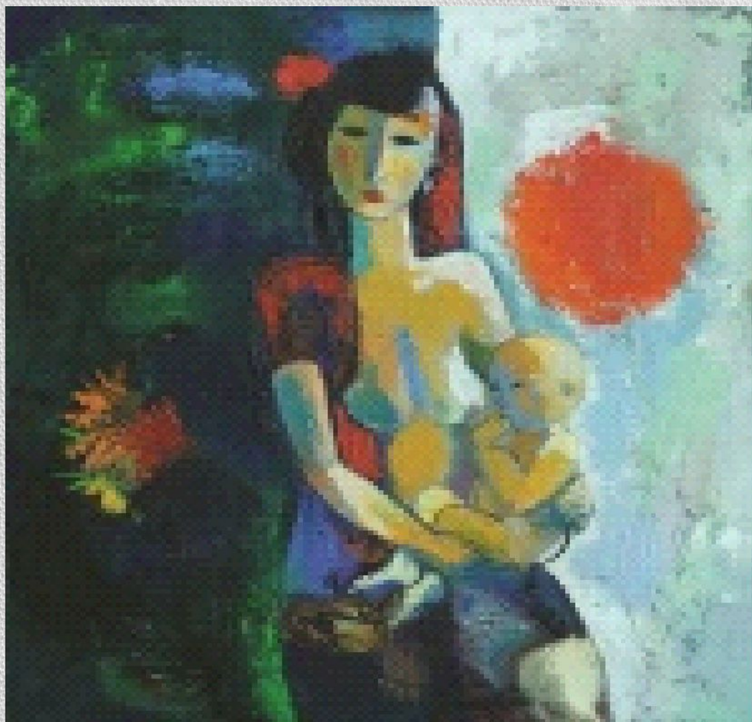
• Мать и дитя Живопись