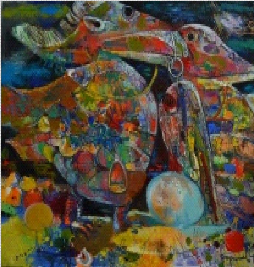
• Птицы Живопись