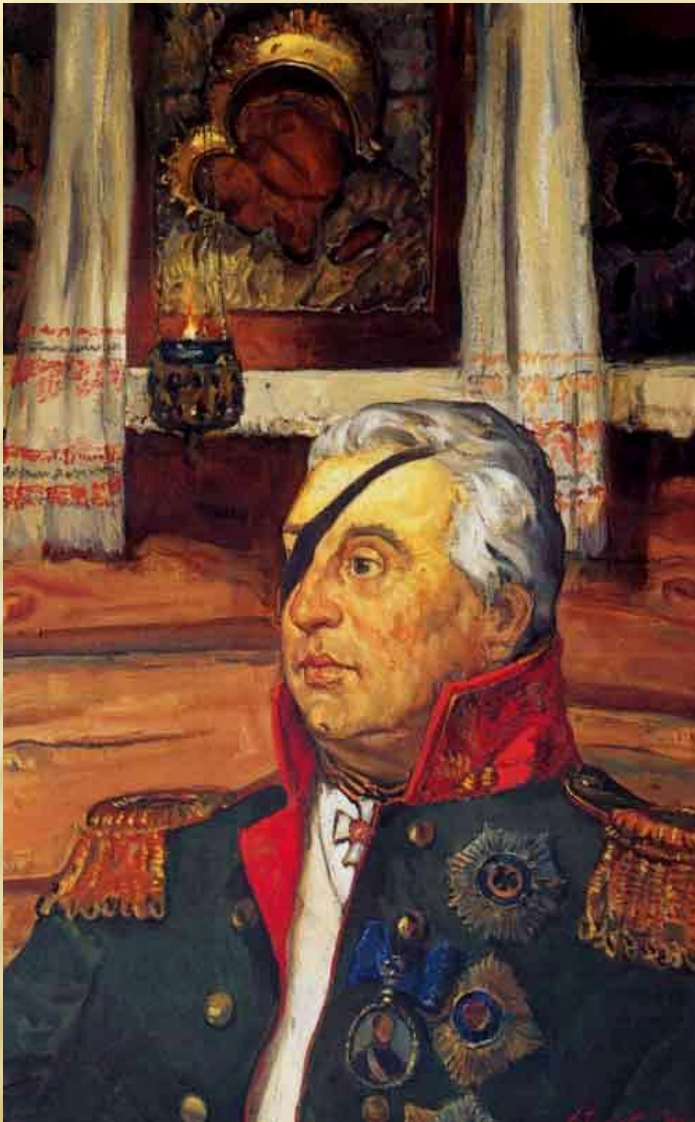
Михаил Илларионович КУТУЗОВ