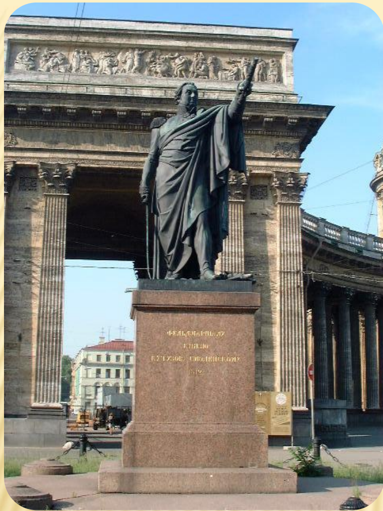
Памятник М.И. КУТУЗОВУ