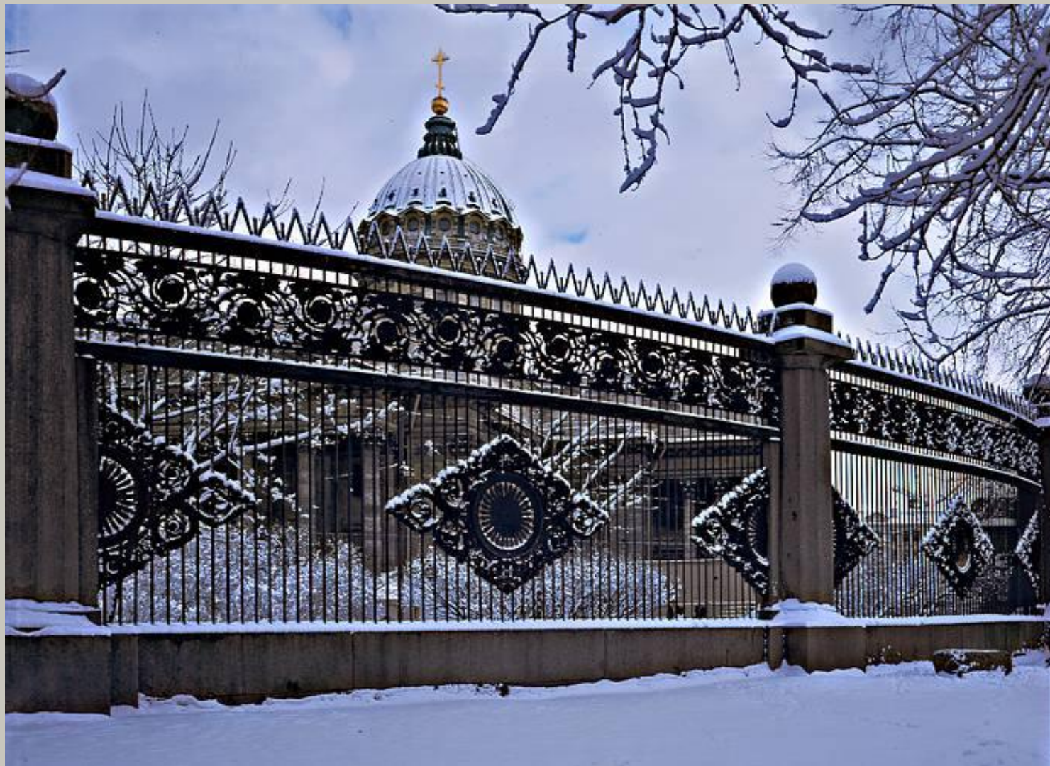
Решетка напротив главного входа в собор