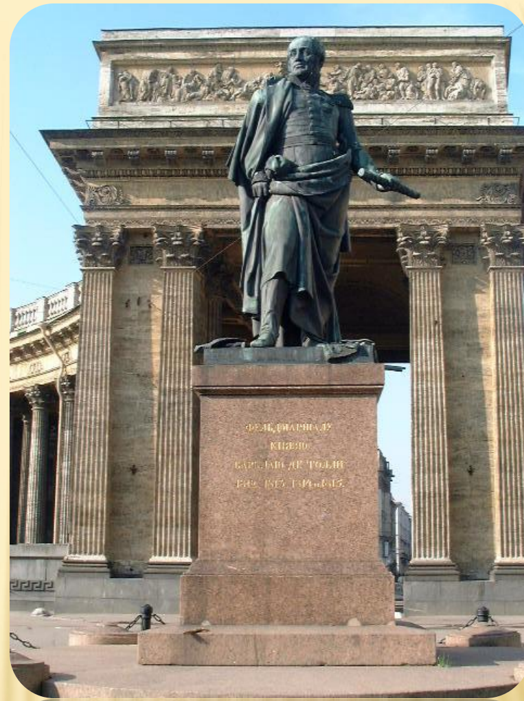
Памятник М.Б. БАРКЛАЮ-ДЕ-ТОЛЛИ