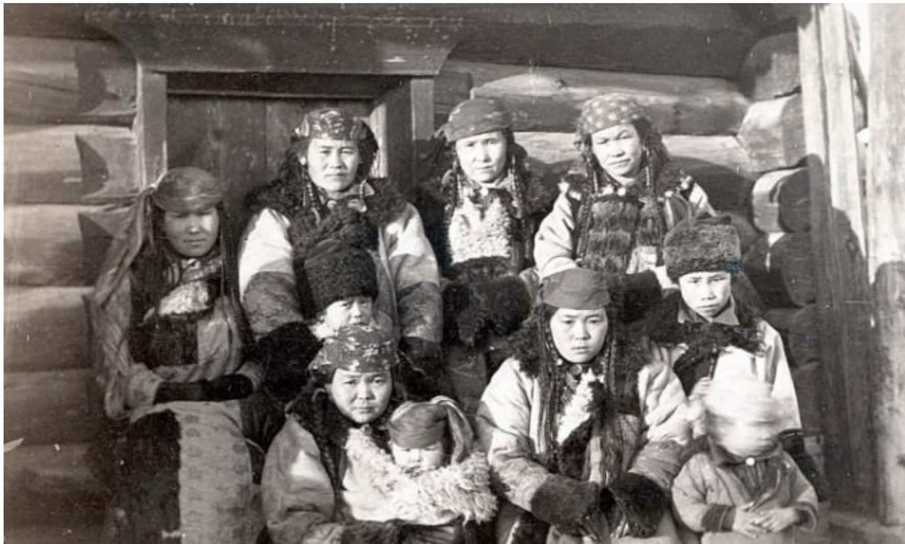
Сибирские татары начала XX