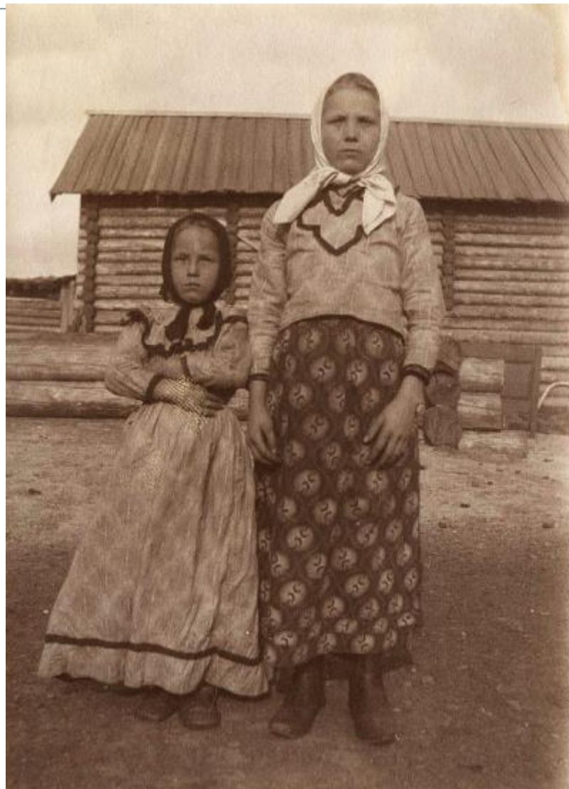
Русские девочки-сибирячки в праздничной одежде. 1911 год