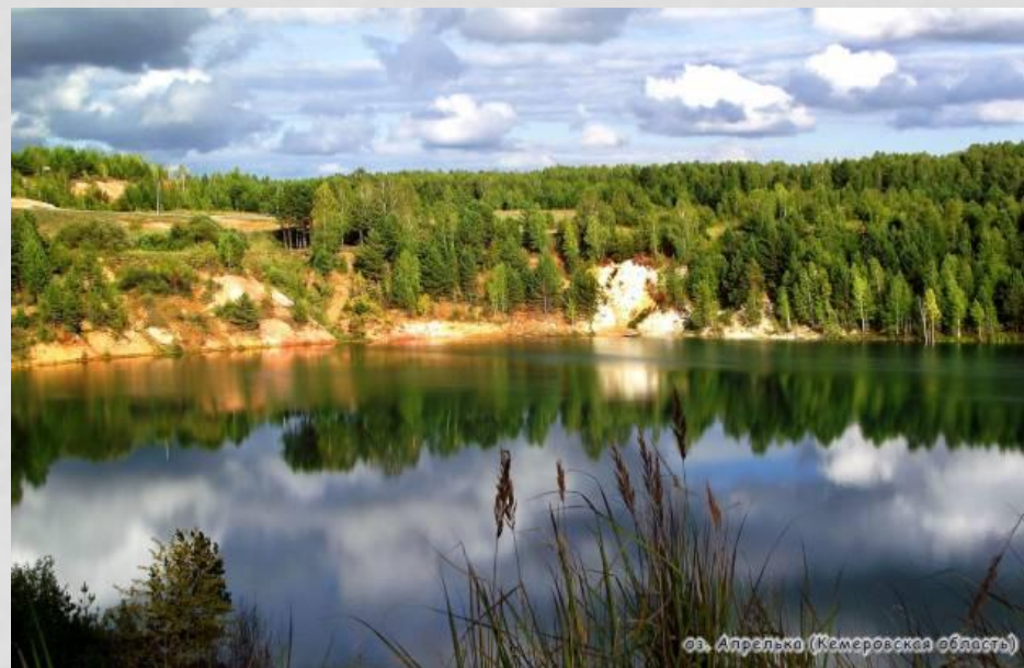
оз. Апрелька (Кемеровская область)