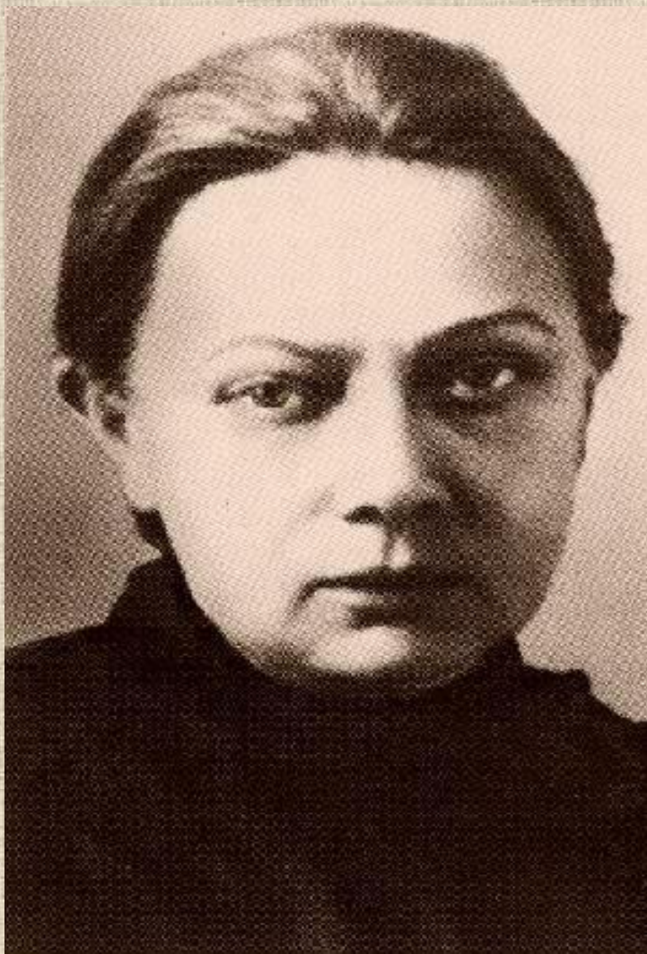
Крупская Надежда Константиновна Заместитель народного комиссара просвещения РСФСР