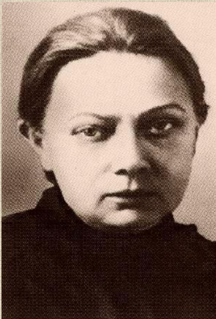
Крупская Надежда Константиновна Заместитель народного комиссара просвещения