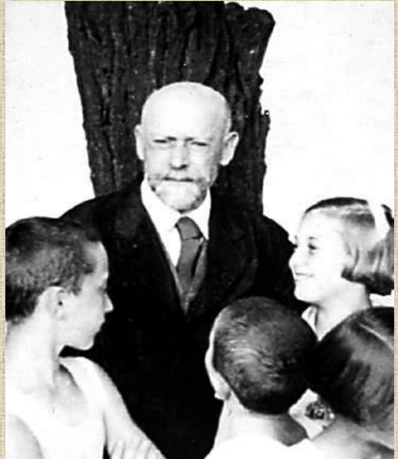
Януш Корчак польский писатель, педагог, врач.