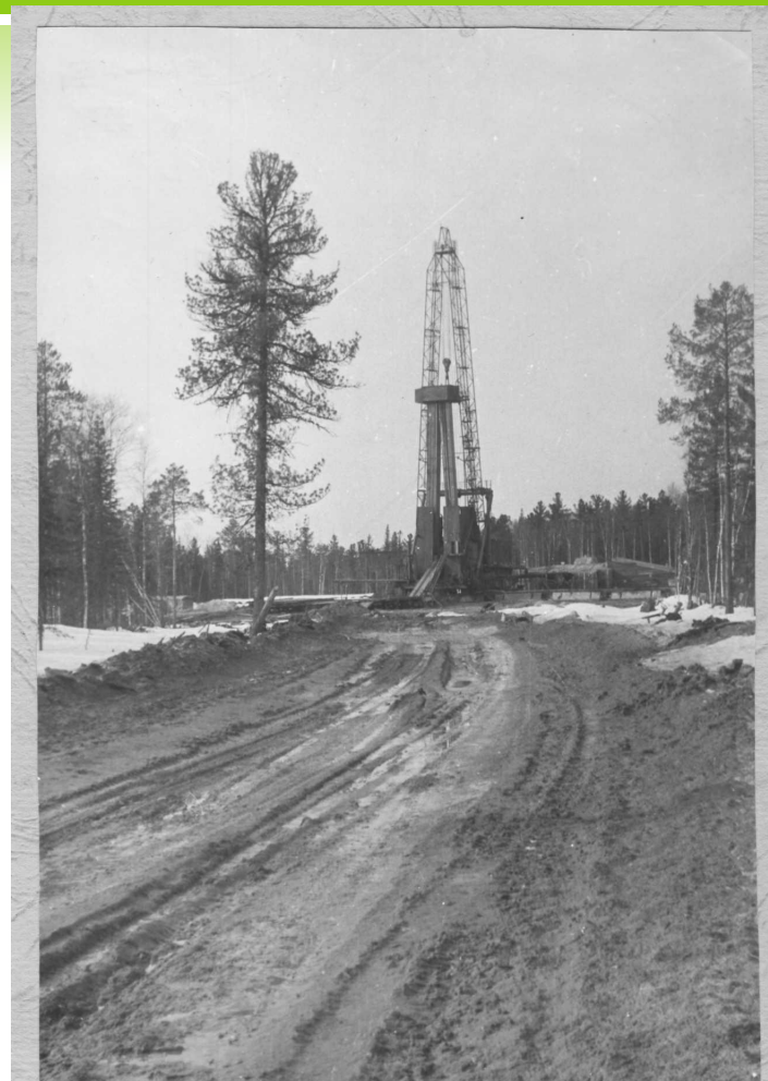
"Путь к нефтяным недрам"