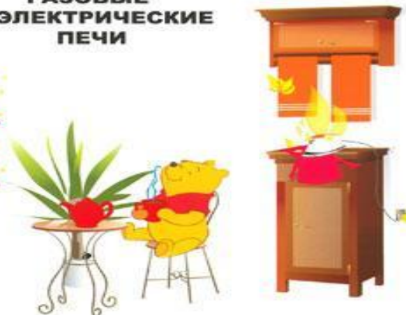
ОСТАВЛЕННЫЕ БЕЗ ПРИСМОТРА ЭЛЕКТРОПРИБОРЫ