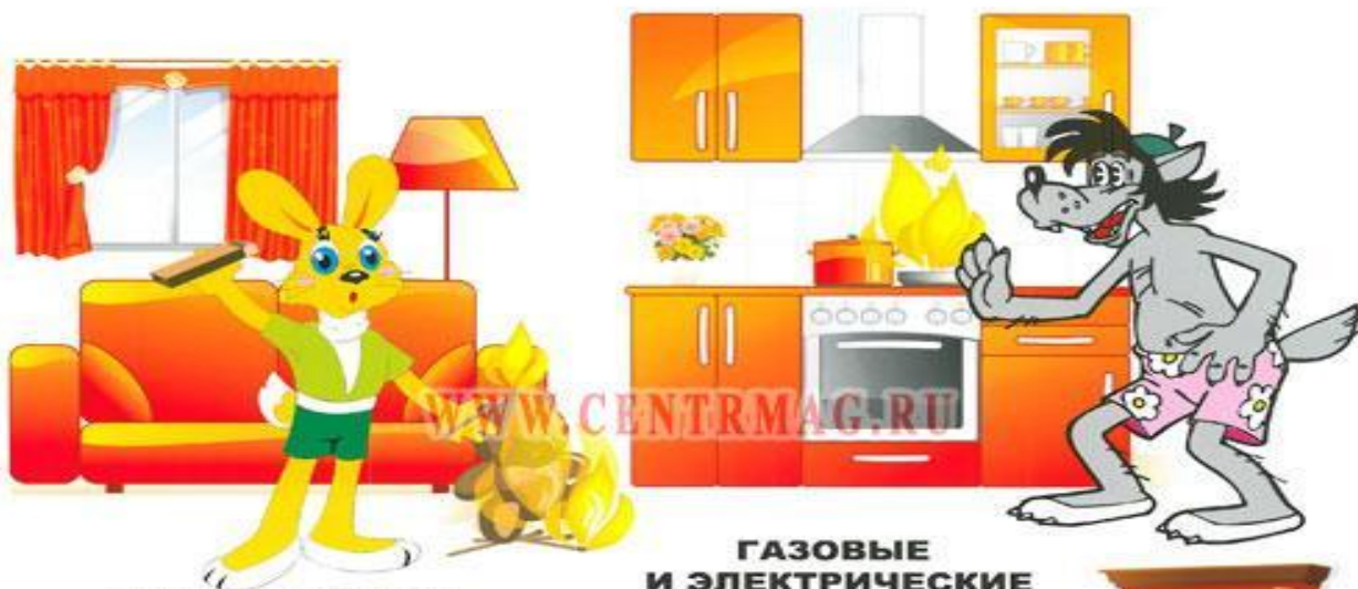
НЕОСТОРОЖНОЕ ОБРАЩЕНИЕ С ОГНЁМ