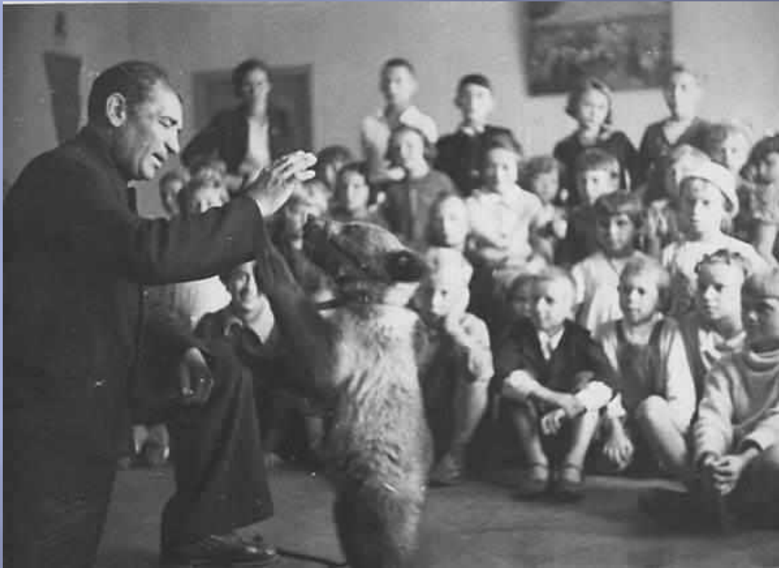
Все блокадные годы в Ленинградском зоопарке работал театр зверей.