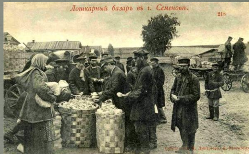
Ложкарный базаръ въ г. Семёновѣ.