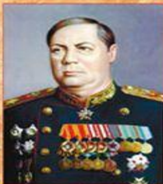
ТОЛБУХИН Фелор Иванович (1894 - 1949)