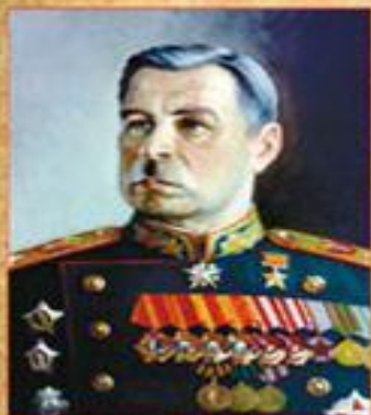
ГОВОРОВ Леонид Александрович (1897 - 1955)