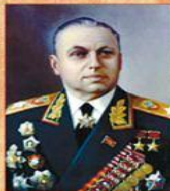
РОКОССОВСКИЙ Константин Константинович (1896 - 1968)