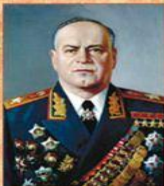
ЖУКОВ Георгий Константинович (1896 - 1974)