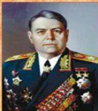
ВАСИЛЕВСКИЙ Александр Михайлович (1895 - 1977)