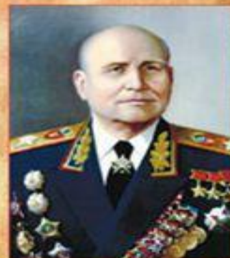
КОНЕВ Иван Степанович (1897 - 1973)