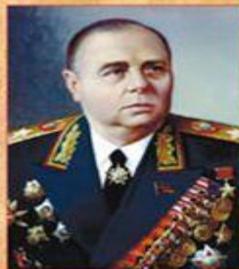
МЕРЕЦКОВ Кирилл Афанасьевич (1897 - 1968)