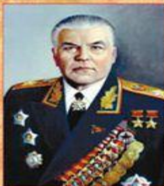
МАЛИНОВСКИЙ Родion Яковлевич (1898 - 1967)