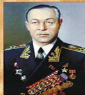
КУЗНЕЦОВ Николай Герасимович (1902 - 1974)