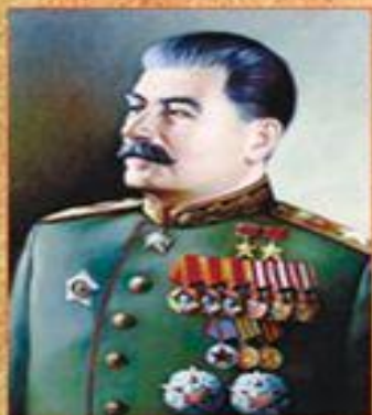
СТАЛИН Иосиф Виссарионович (1879 - 1953)