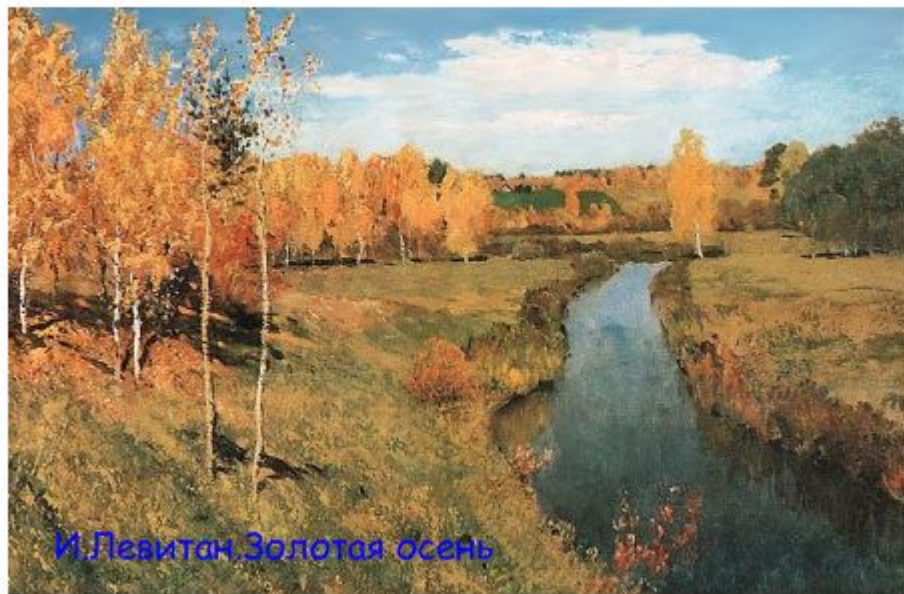
И. Левитан. Золотая осень