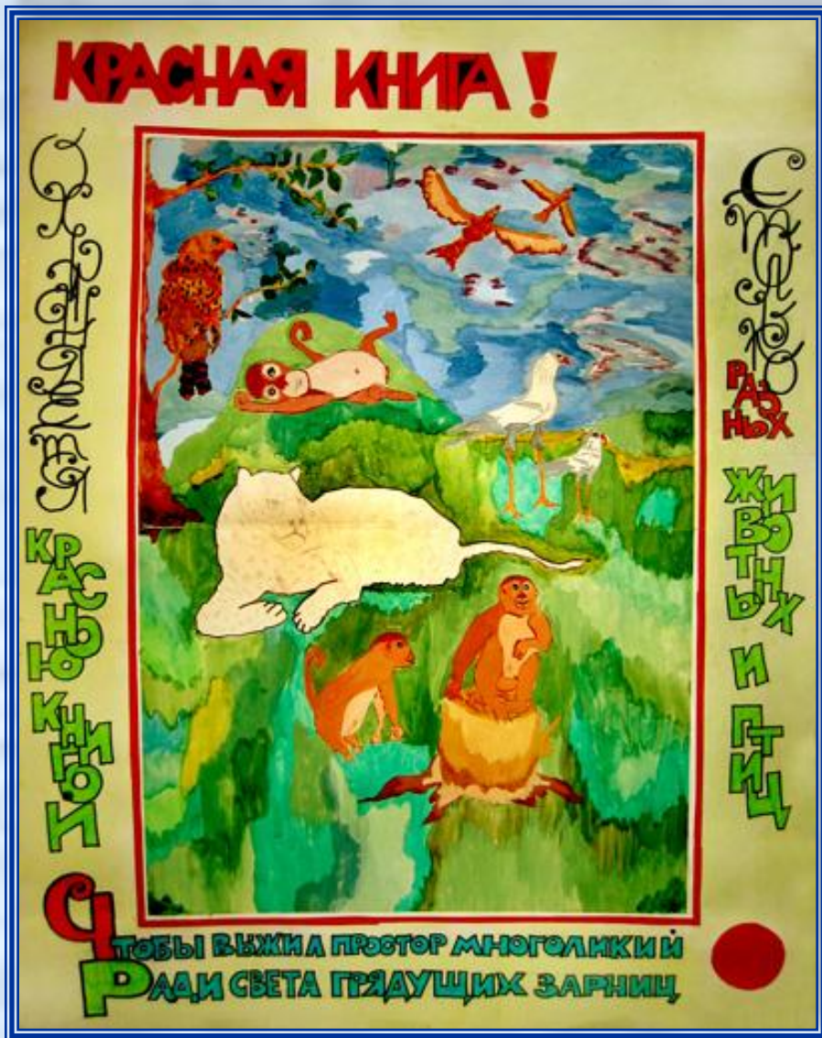
плакат «Красная книга»