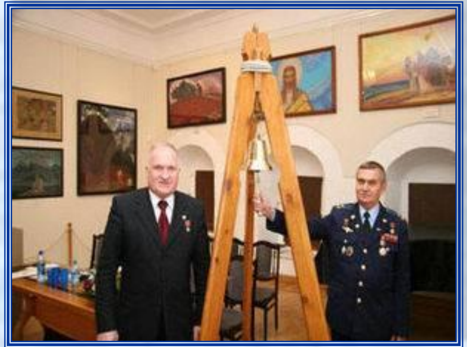
На фото: летчики-космонавты В. М. Афанасьев и А.Н. Березовой

В России акция «Колокол Мира в День Земли» проводится с 1998 года по инициативе летчика-космонавта СССР, Героя Советского Союза А. Н. Березового