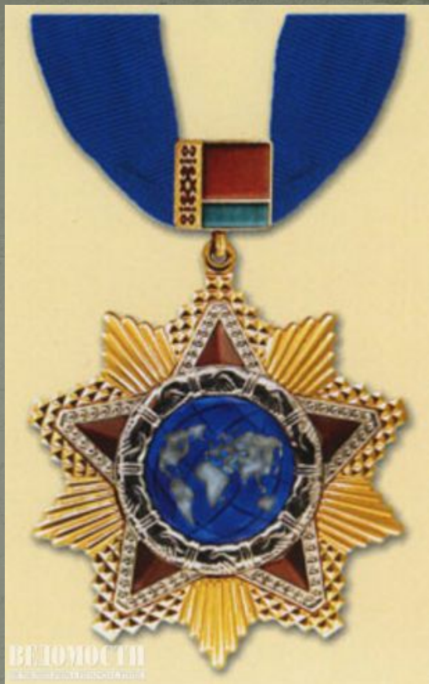
Орден Дружбы народов (Белоруссия).