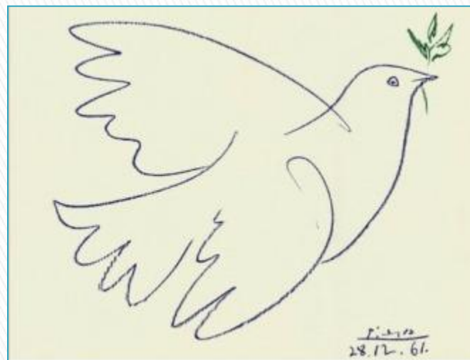
Пабло Пикассо «Голубь мира»