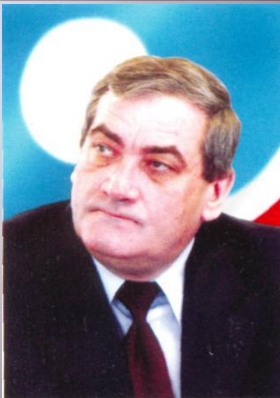
В.А.ШТЫРОВ, 2-й Президент Республики Саха (Якутия)