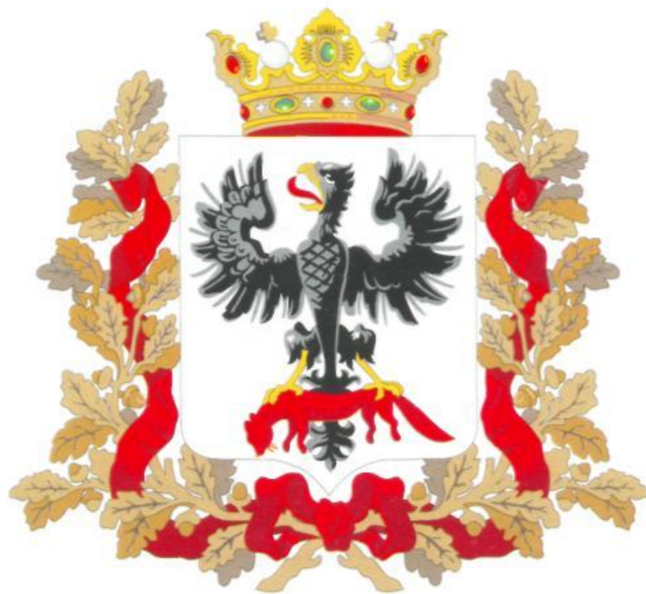
Герб Якутской области Высочайше утвержден 5 июля 1878 г.