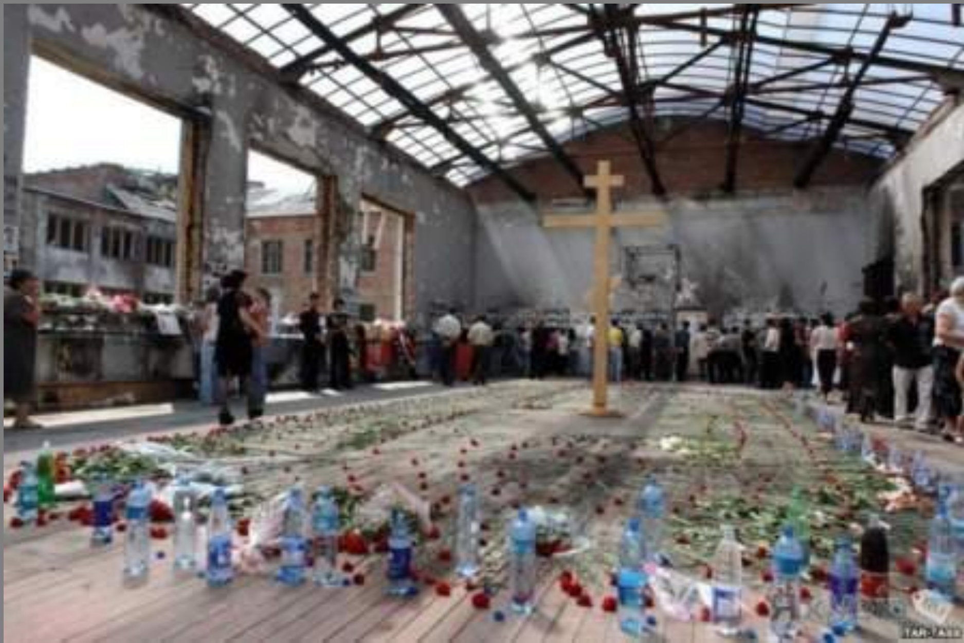
Разрушенный спортзал бесланской школы