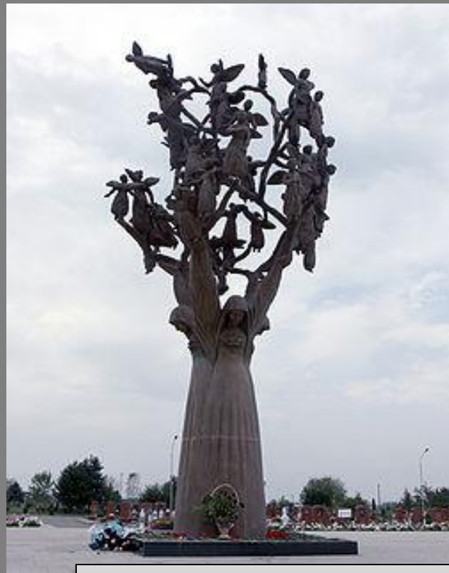
А. Корнаев, З. Дзанагов Дерево скорби, 2005 Бронза. Высота – 9 м.

Город ангелов — название мемориального кладбища, находящегося в Беслане на котором похоронены 266 человек, погибших во время террористического акта в Беслане 1 сентября 2004 года.