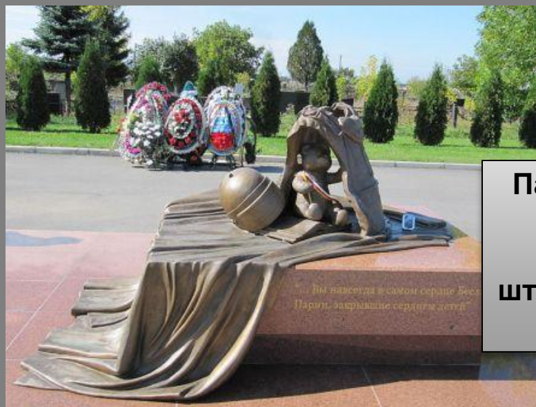
Памятник бойцам спецназа, погибшим при штурме бесланской школы № 1.