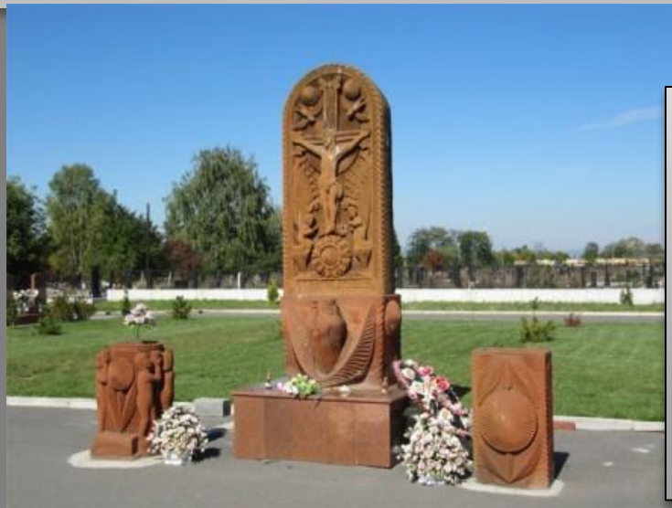
Хачкар (вид армянских архитектурных памятников, представляющий собой каменную стелу с резным изображением креста), подаренный детьми Армении.