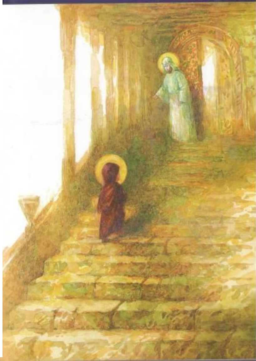
«Введение во храм Пресвятой Богородицы»