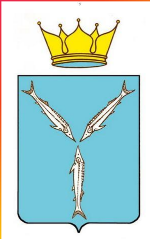
Герб Саратовской области