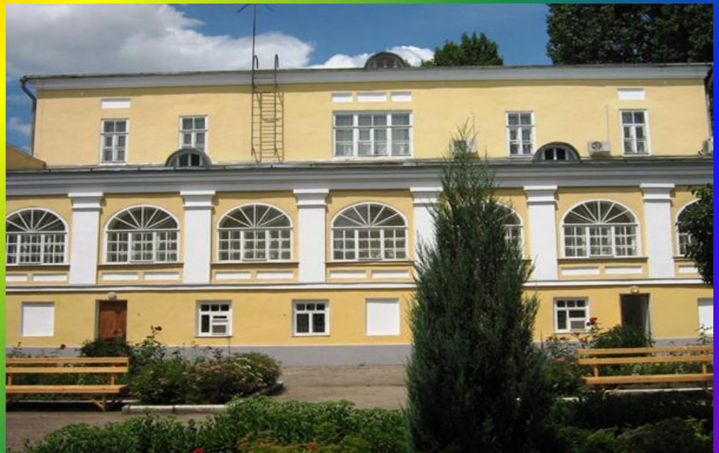
Дом – музей К. Федина