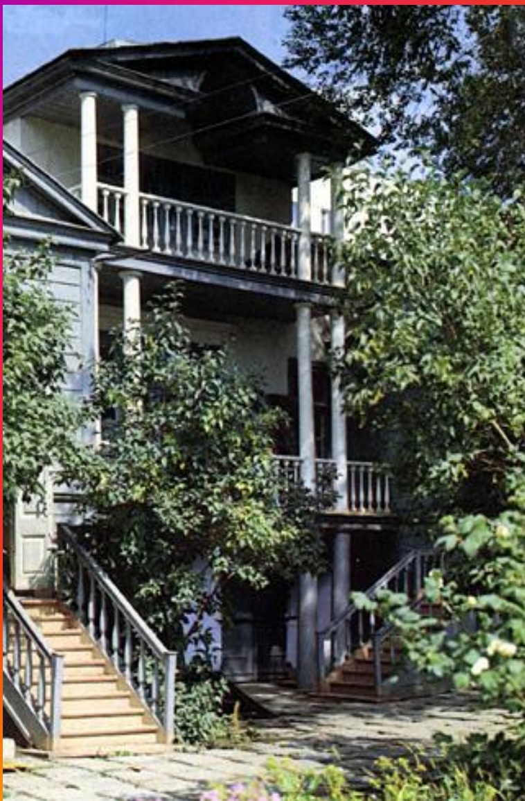
Дом – музей Н.Г. Чернышевского