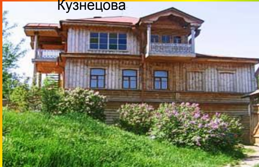
Дом – музей П. Кузнецова