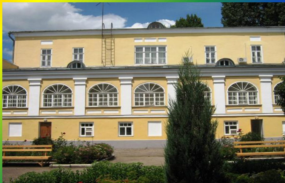
Дом – музей К. Федина