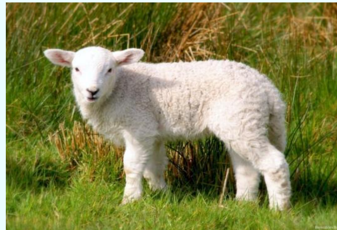
Төлү - хураган