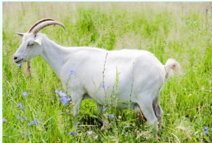
Кыс - ошку