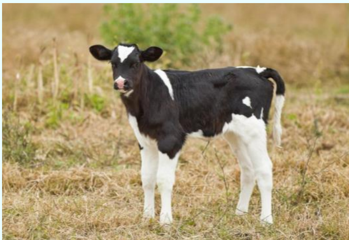
Чаш толун - бызаа