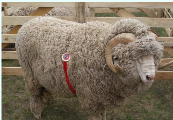
Бүдүрүкчү - кошкар