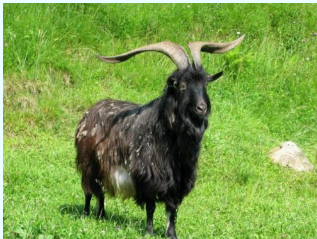
Будурукчу - хуна