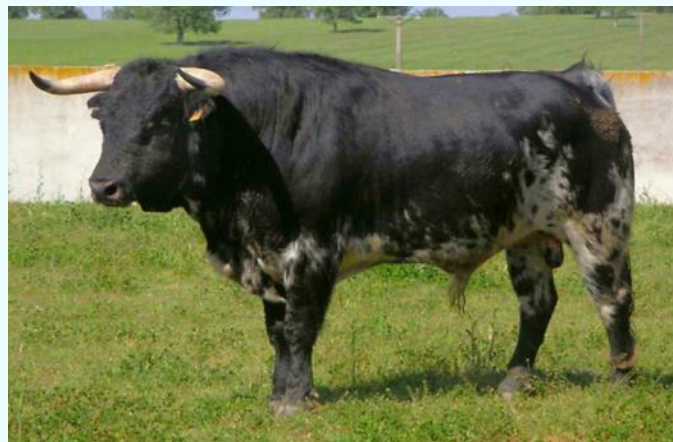
Будурукчу - буга