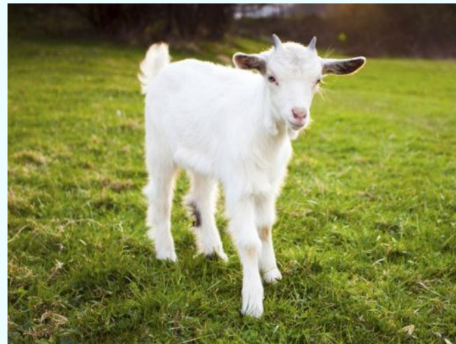
Толу - анай