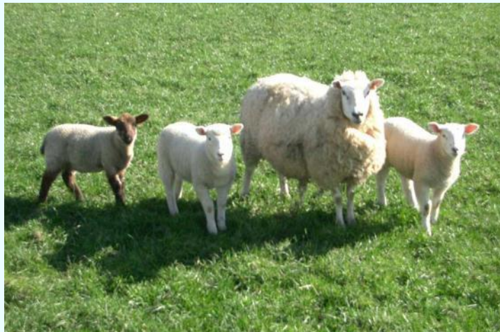
Ниити ады - хой