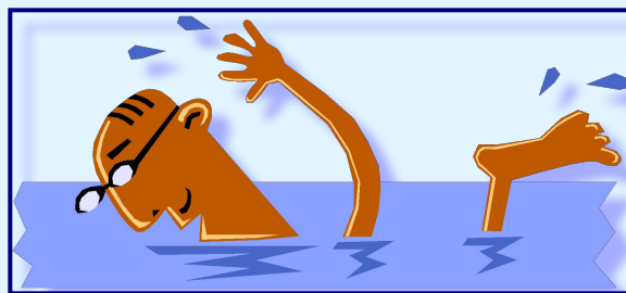
купание в водоеме