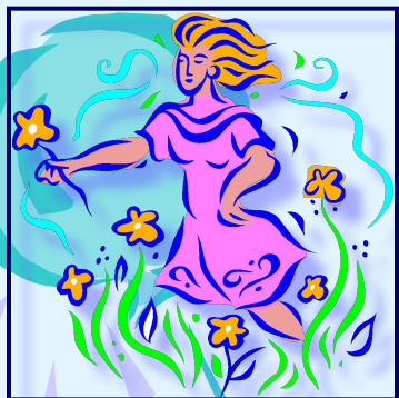
прогулки на свежем воздухе