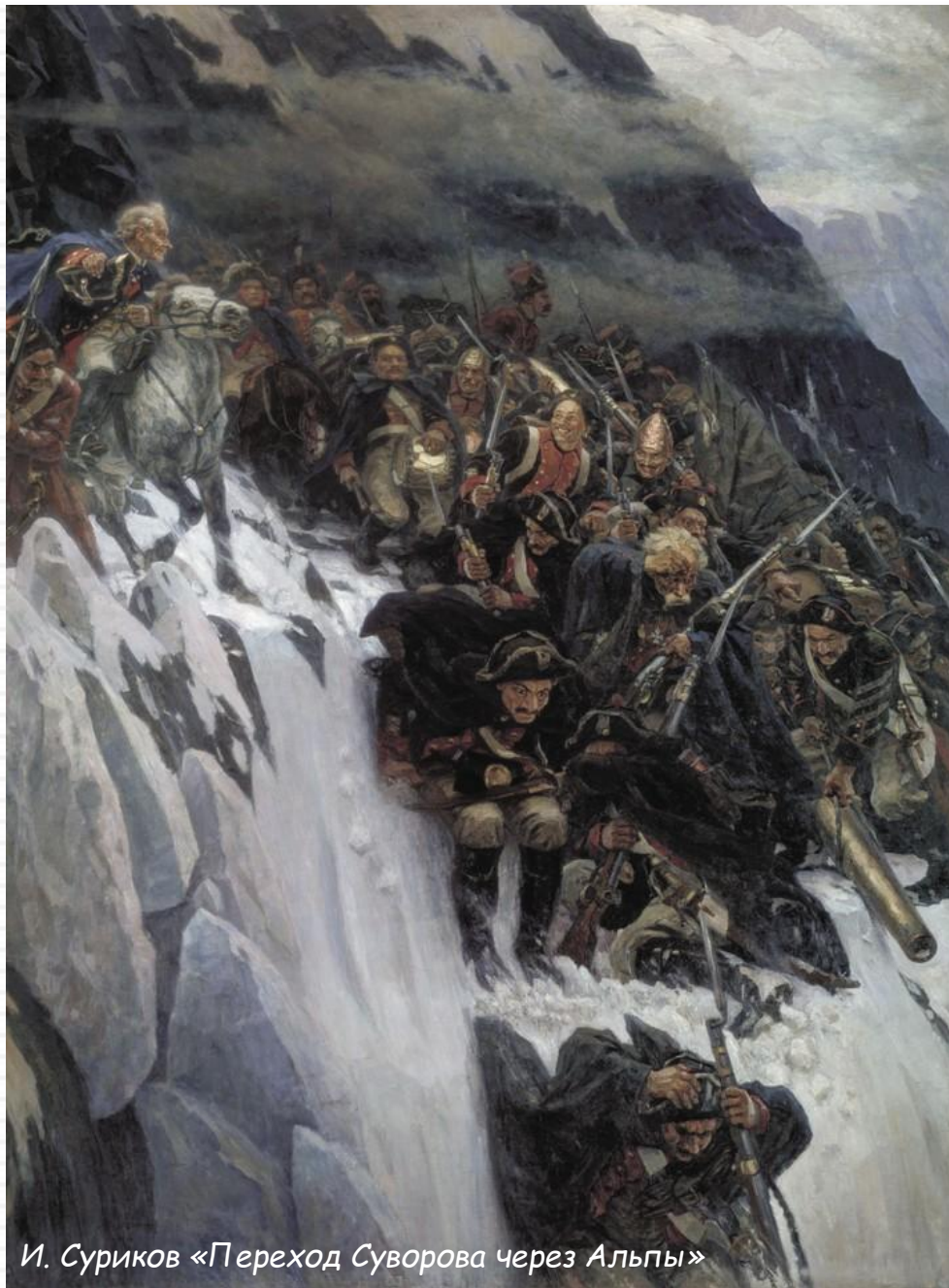
И. Суриков «Переход Суворова через Альпы»