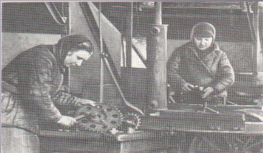
Женщины заменили у станков мужчин