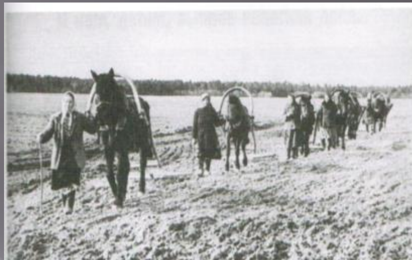
Женщины и дети заменили отцов