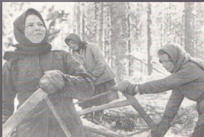
В Северном лесу