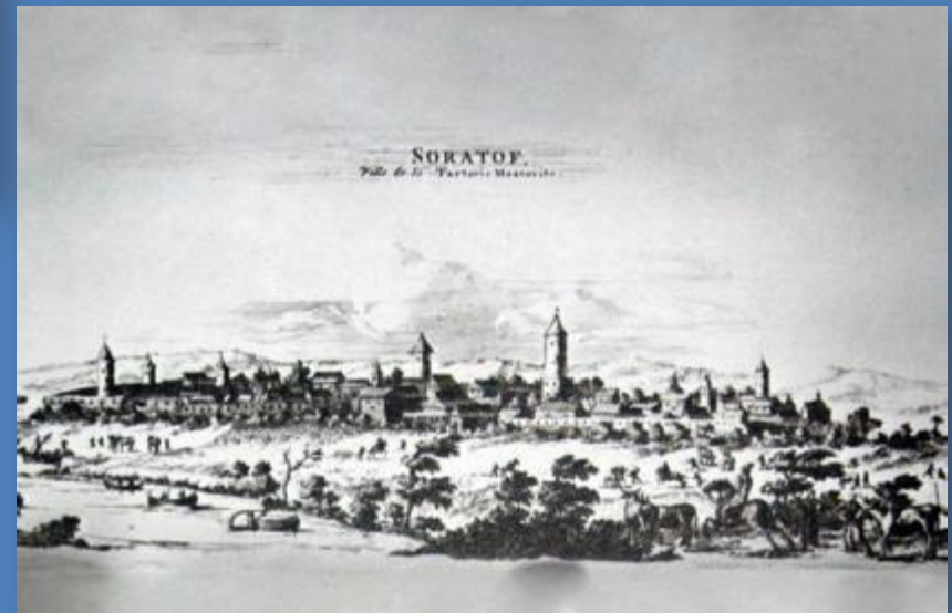
Запись об основании города Саратова в 1690 году.

Вѣтъа 27и году мѣ дкѣ в п днѣ Нѣ па мѣ погодѣ поѣ са приишѣ стѣ стѣ стѣ стѣ стѣ три торіѣ и по стѣ стѣ стѣ стѣ Федо мѣ хѣ и ѡ шѣ стѣ ро на за и хѣ стѣ ро стѣ стѣ стѣ стѣ и лѣ