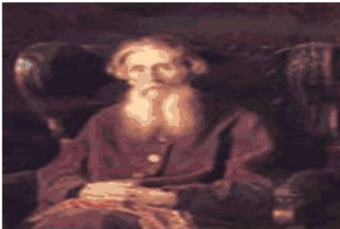
Владимир Иванович Даль