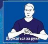
Держаться за руки