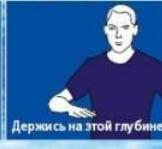
Держись на этой глубине