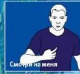
Смотри на меня