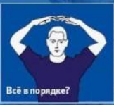
Всё в порядке?