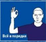
Всё в порядке