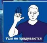
Уши не продуваются