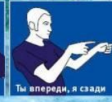
Ты впереди, я сзади