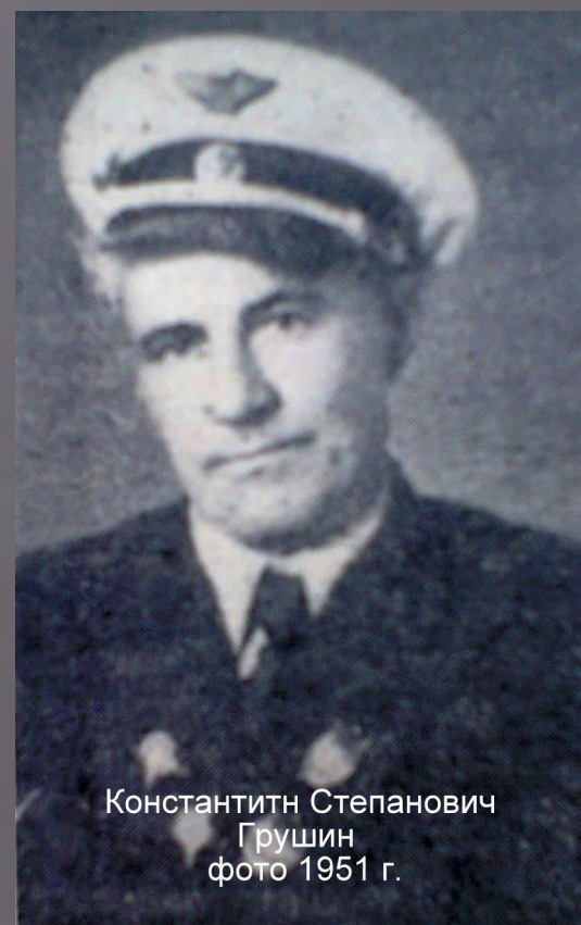
Константин Степанович Грушин фото 1951 г.