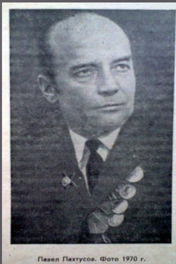
Павел Пахтусов. Фото 1970 г.