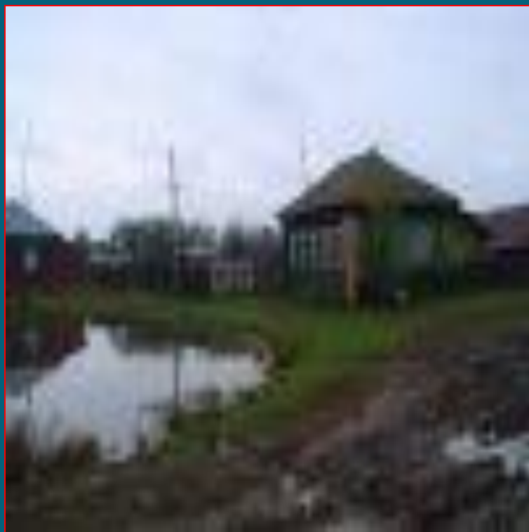
Озеро на улице Сергея Зырянова