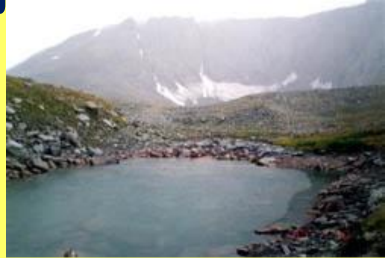
оз. Балабан- гы