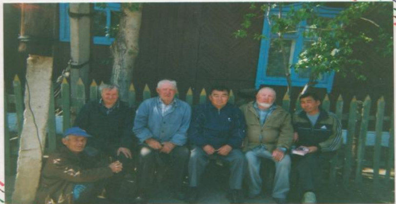
Новосибирск областин, Андреевск района, Тычкино селэнд эцкиннь үүрмүдлэ.