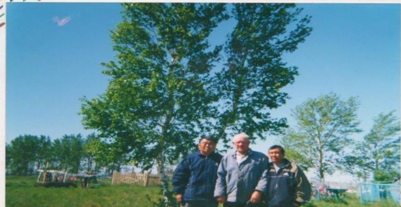
Санлын поезддар йовад Сиврин Һазрт күрэд Садн элгн аннь цогцд седклэн тэвж мөргв.