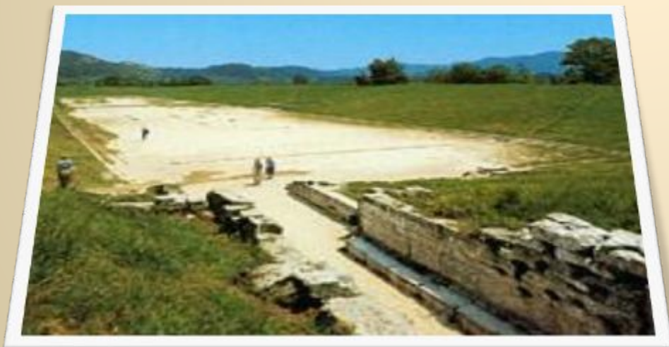
Стадион в древней Олимпии, на котором проходили олимпийские состязания.

Особенно почетной считалась победа в стадиодроме. Именем атлета, который выиграл эти состязания, называлась следующая Олимпиада. Олимпиоников (победителей Игр) венчали в храме Зевса оливковой ветвью, срезанной золотым ножом в священной роще. От числа атлетов-победителей зависел политический престиж города в эллинском государстве.