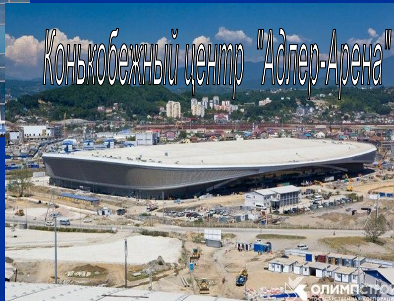
Конькобежный центр "Адлер-Арена"