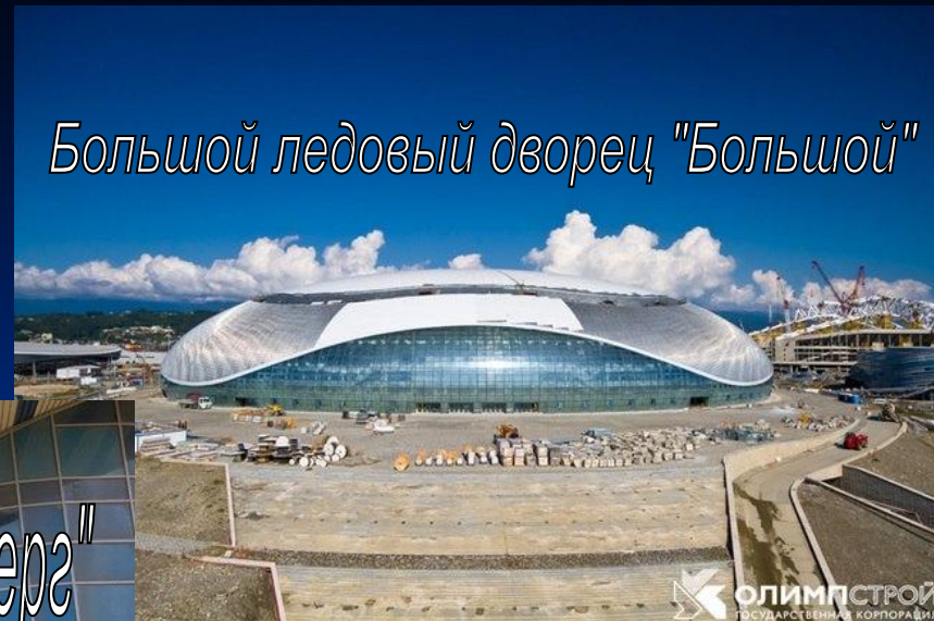
Большой ледовый дворец "Большой"