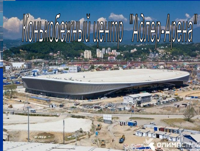
Конькобежный центр "Адлер-Арена"