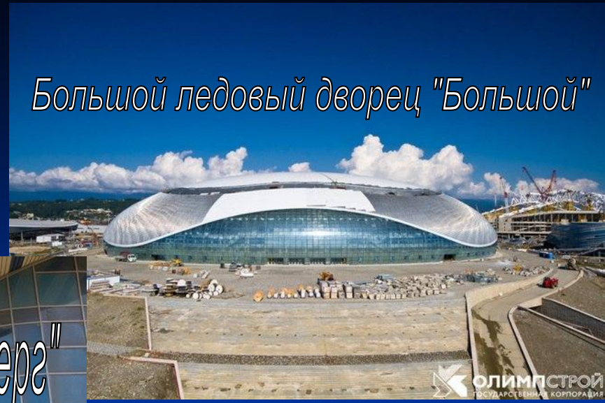
Большой ледовый дворец "Большой"