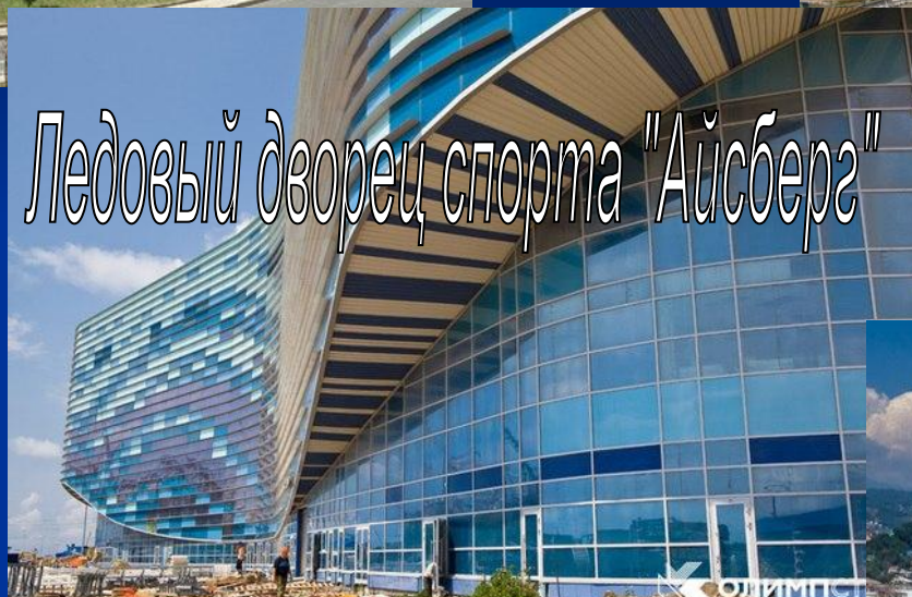
Ледовый дворец спорта "Айсберг"