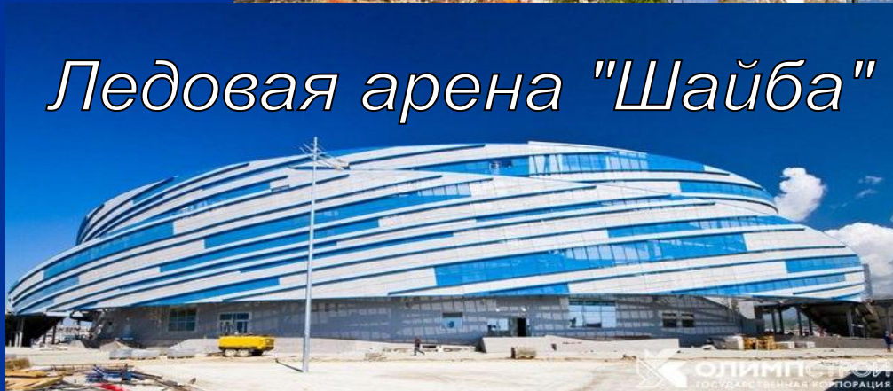
Ледовая арена "Шайба"