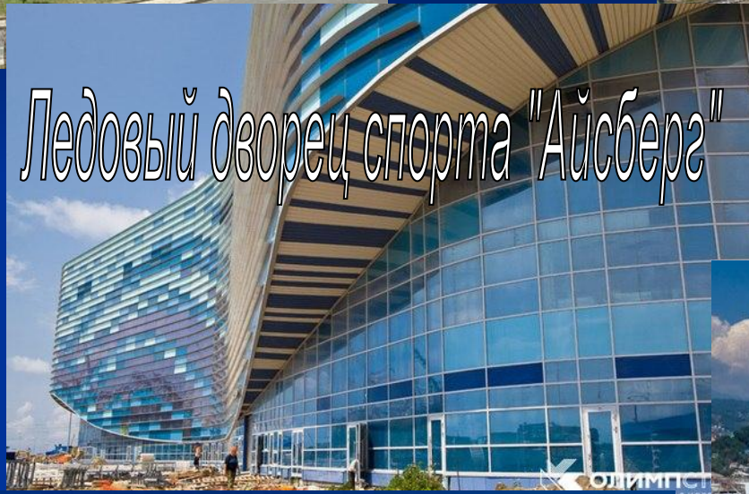
Ледовый дворец спорта "Айсберг"