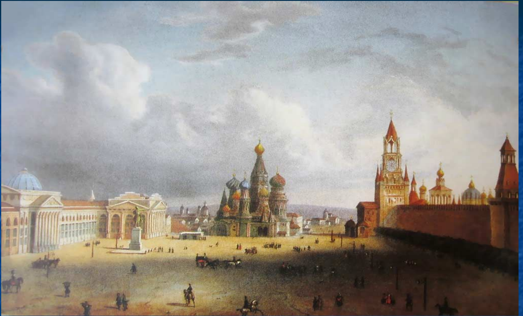
«Московский Кремль 16-17 веков»