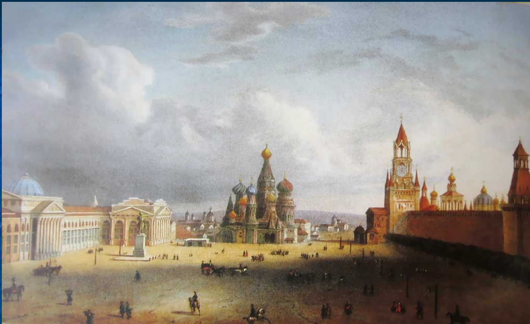
«Московский Кремль 16-17 веков»