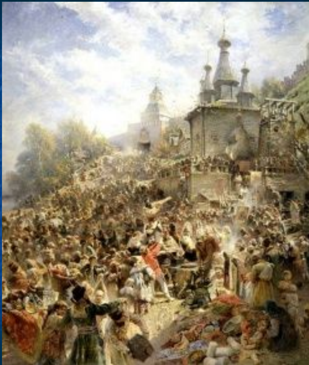
К. Маковский «Минин на нижегородской площади»