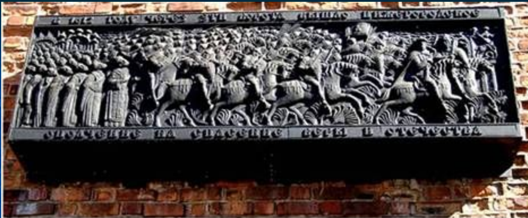
Барельеф посвящённый народному ополчению Минина и Пожарского 1611 - 1612 г.г. на Ивановской Башне Нижегородского кремля. Чугун, сталь. 100 x 3000 x 30. 2000 г.

Барельеф, посвящённый народному ополчению, на Ивановской башне Кремля